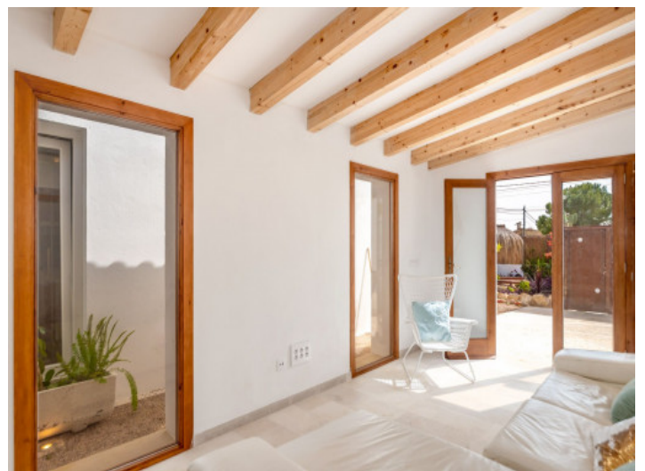
Zona de invitados

Toda la información como mejor se puede saber, salvo por error durante el periodo de venta. Sirva este documento como un informe previo, las bases legales solo serán válidas a través de un contrato de compra acordado ante Notario.