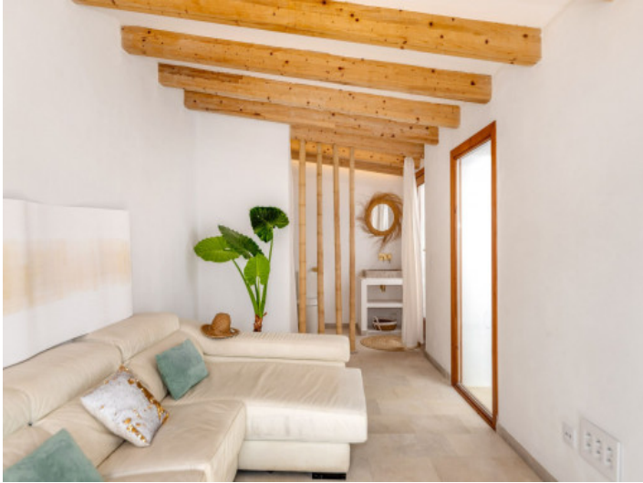
Zona de invitados