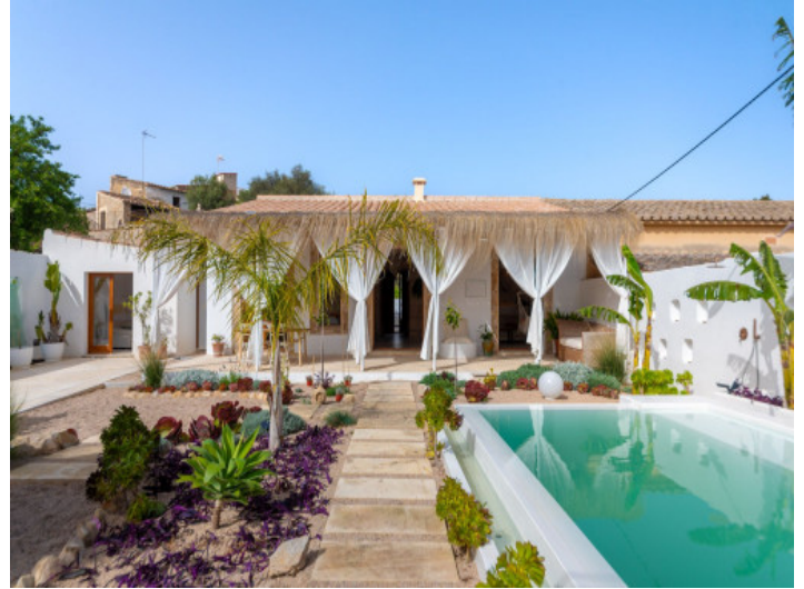
Estupendo chalet con piscina y jardín en Establiments