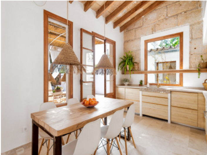
Comedor y cocina